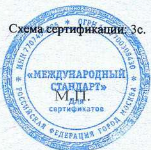
Схема сертификации: Зс.